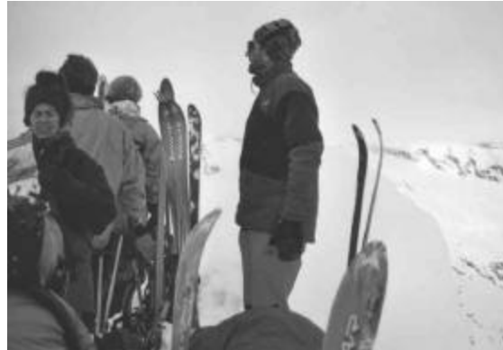
Beschränkte Gipfelsicht auf der Cima de la Bedoleta