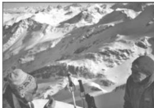
F6 Gipfelimpressionen Köbi und Hugo