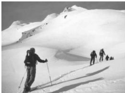
Weite Hänge zum Chilchalhorn

Abfahrt im unberührten, stiebenden Pulverschnee Schwung auf Schwung bis 2300 m. Rast, sönelen. Wiederaufstieg bis 2600m und nochmals eine Abfahrt mehr nach rechts Richtung Hinterrhein – ein voller Genuss.