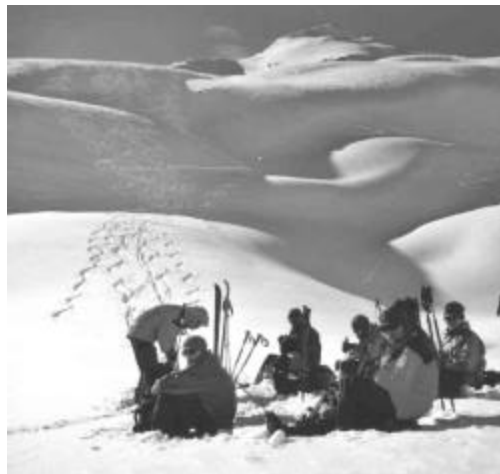
Rast nach genussvoller Abfahrt