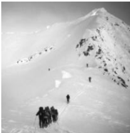
In der Scharte vor dem steilen Schlusshang

Abfahrt genießen wird. Gipfel an 12.15 h (F5, F6). Einzigartige Rundsicht und beeindruckende Tiefblicke, z. B. zur glitzernden Ebene des Lago di Monte Spluga. Sünelen und den Hunger