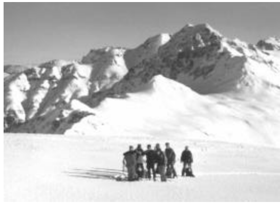
Blick zum Vogelberg, dem Übergang Vals - Hinterrhein