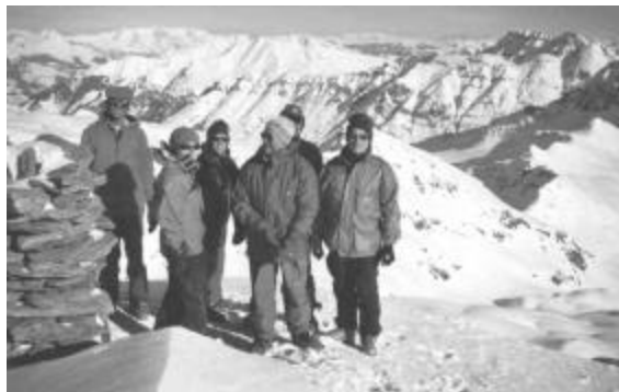
Auf dem Gipfel Chilchalhorn