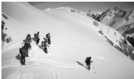
F7 Cornelia startet zur Abfahrt vom Sattel im NO-Grat