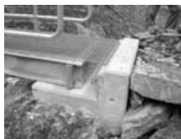
Der Steg passt genau in die Fundamente