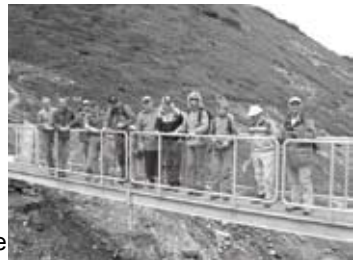
Am Schluss die Belastungsprobe

Es ist geschafft. Das langwierige, stolze und anspruchsvolle Projekt „Steg“ wurde an diesem Tag abgeschlossen. Ein Beitrag zum SAC Thema 2008 „sichere Hüttenwege“ wurde durch unsere Sektion bereits vorausschauend geplant und nun realisiert. An dieser Stelle möchte ich im Namen der Hüttenkommission allen Konstrukteuren, Helfern und Spendern die sich in irgend einer Art am Projekt beteiligt haben, ganz herzlich danken. Ohne sie wäre eine Frondienstarbeit in diesem Umfang nicht realisierbar.