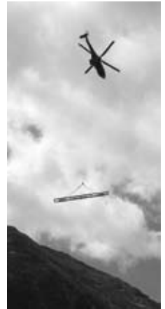
Der Steg in luftiger Höhe