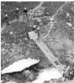
Absetzen des Steges