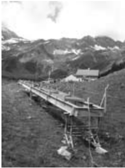
Der Steg ist bereit“

11.30h!! Ein Super Puma der Schweizer Luftwaffe setzte den Steg sicher und präzise auf die exakt vorbereiteten Auflager. Mit zwei zusätzlichen Flügen konnte noch Werkzeug und Kleinmaterial an die richtigen Destinationen gebracht werden. Bereits um 13.00h wurde das ganze Team bei Helen und Beat mit Kaffee und Kuchen verwöhnt.