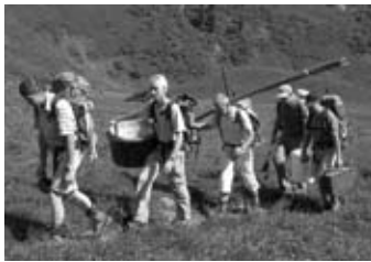
Tragete des Materials zur Brücke