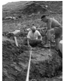
Einmessen des Fundmentes