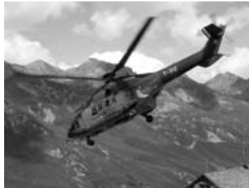
Spektakulärer Einsatz mit dem Super-Puma