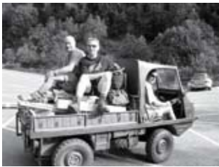
Der Materialtransport zur Sardonaalp