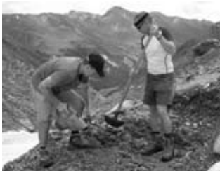
Bohrlöcher für die Fundmente